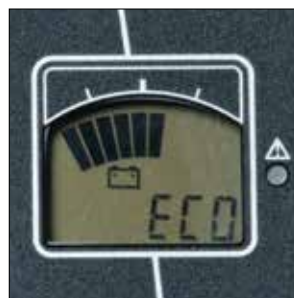
Opción de dos modos operativos preprogramados