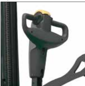
Controles a derecha e izquierda

La versátil gama de apiladores con plataforma AXiA EM de 1.2 y 1.6 toneladas es la solución perfecta para aplicaciones de apilado a niveles intermedios en espacios reducidos.