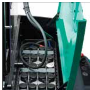
Tapa de la batería fabricada de acero