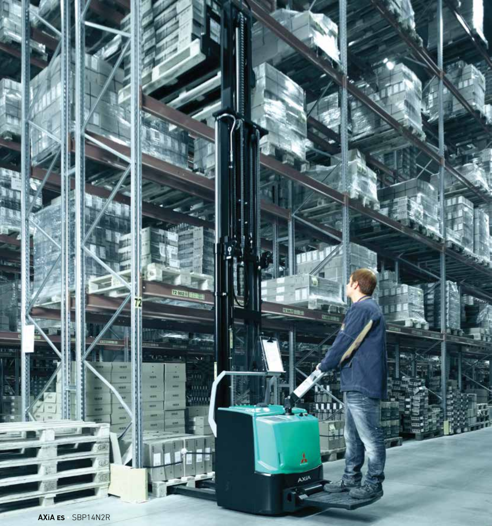
AXiA ES SBP14N2R