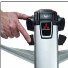
Sencillos controles de elevación y descenso