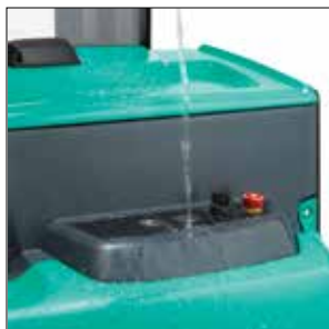
Chasis resistente al agua y al polvo