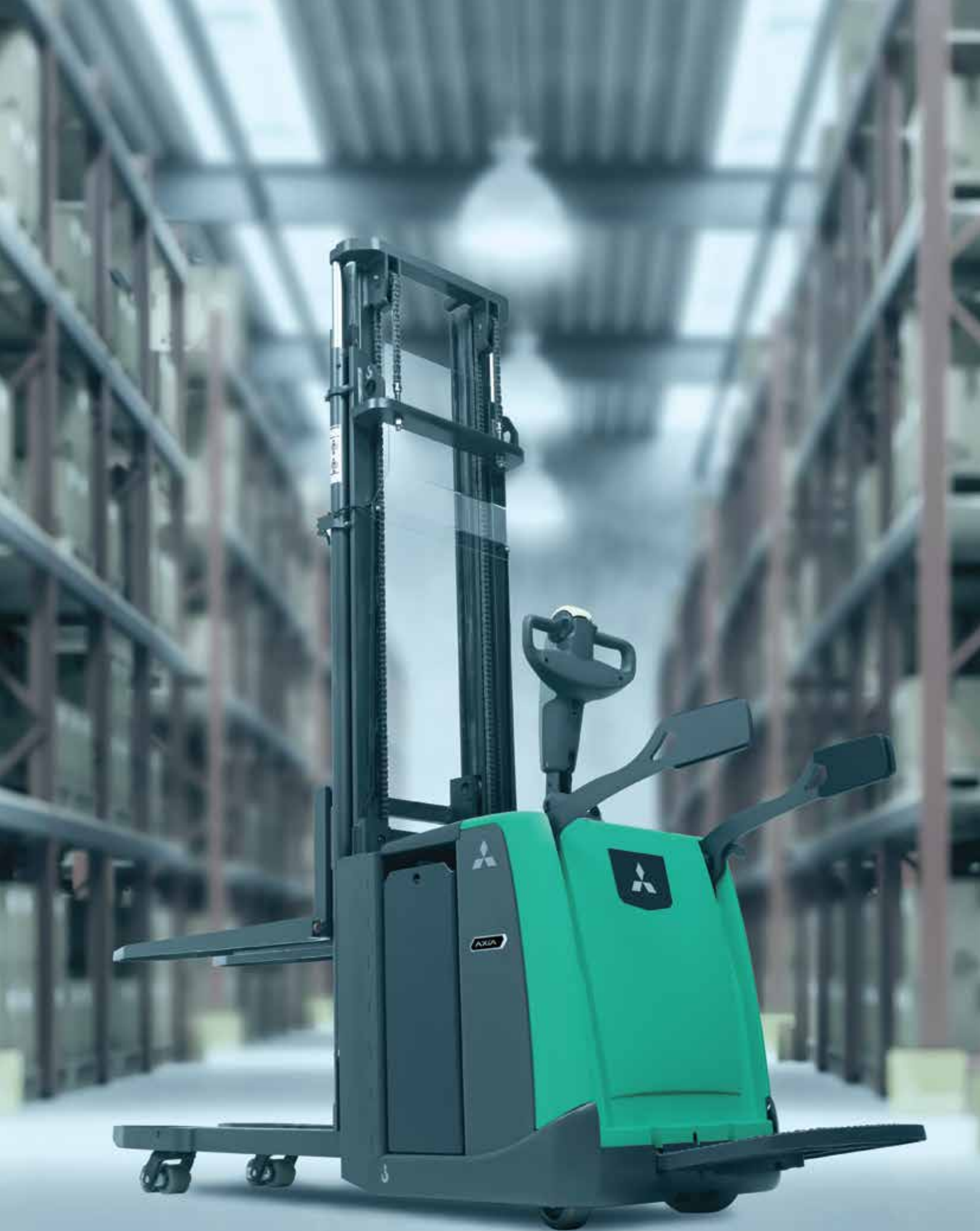
AXiA EM • SBV12P