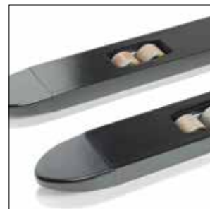
Horquillas robustas y cónicas