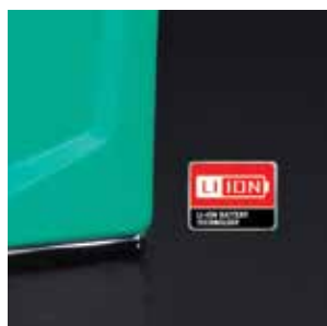
Batería de iones de litio (opcional)