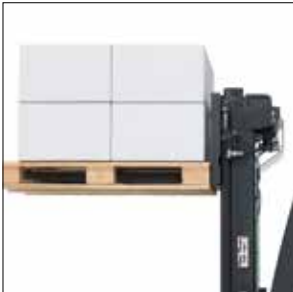
Elevación inicial (opcional)

Apiladores con plataforma 1.2–1.6 toneladas