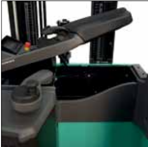
Almacenamiento en el reposabrazos ajustable