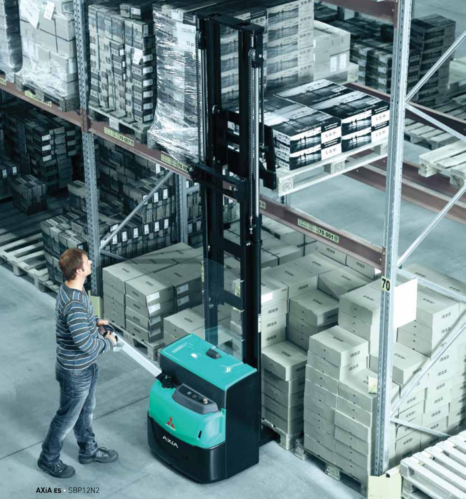
AXiA ES • SBP12N2