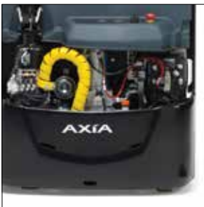
Potente motor de propulsión de CA