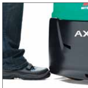
Proximidad al suelo