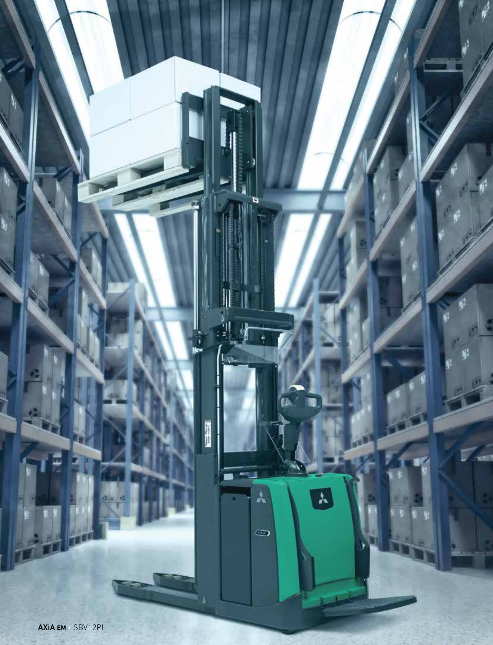
AXiA EM · SBV12PI