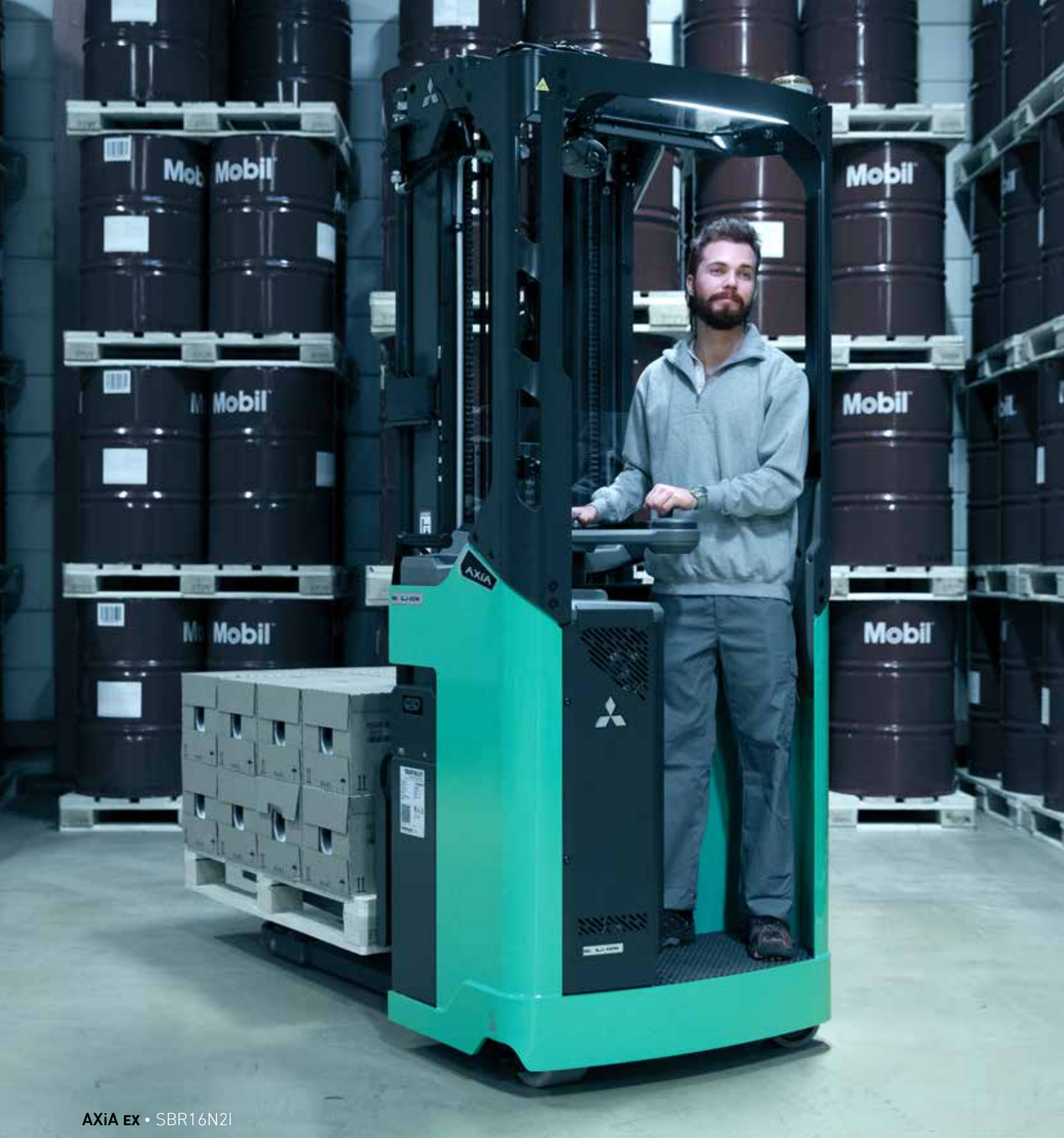
AXiA EX • SBR16N2i