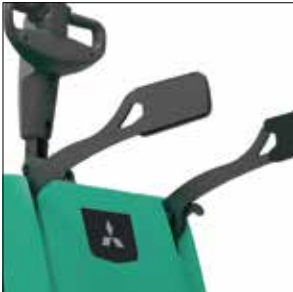
Protecciones laterales plegables (opcional)

Apiladores con plataforma 1.2-1.6 toneladas