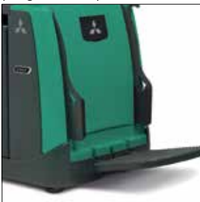
Robusta plataforma de hierro fundido