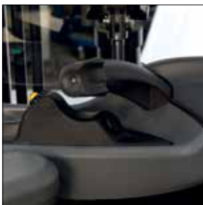
Timón ergonómico con control de velocidad