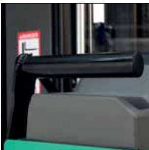
Estante de accesorios con protección del salpicadero (mini)