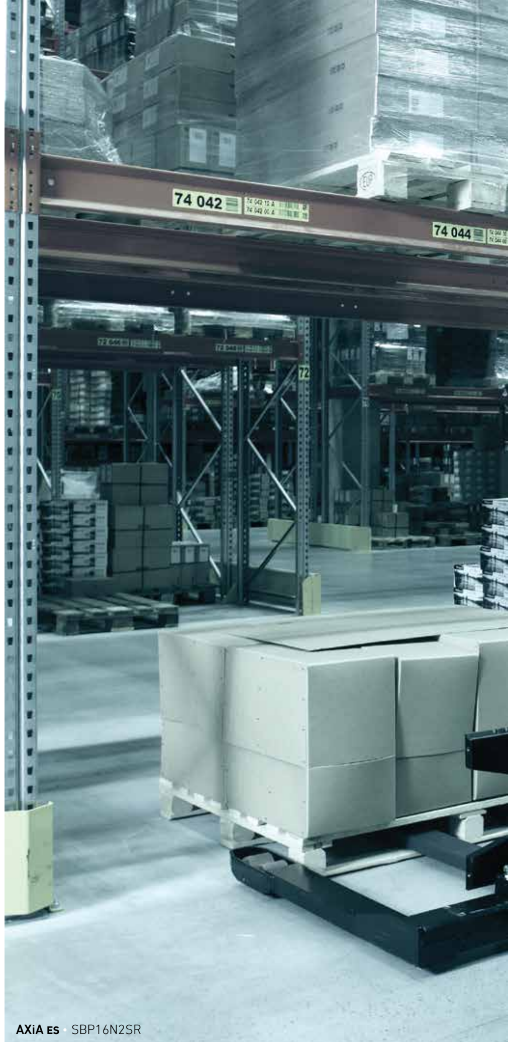
AXiA ES • SBP16N2SR

¿Preocupado por los tiempos de inactividad? El chasis sellado y resistente al agua y los puntos de mantenimiento de fácil acceso hacen que las reparaciones (en caso de ser necesarias) y el mantenimiento se realicen de forma rápida y sencilla y con un mínimo esfuerzo.