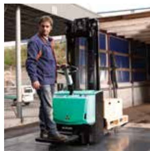
Componentes a prueba de agua con grado de protección IP54