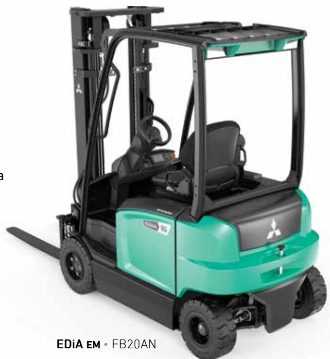
EDiA EM • FB20AN

Reduce la velocidad de forma dinámica al comienzo y durante el giro, lo que le permite mantener la máxima estabilidad en las curvas.