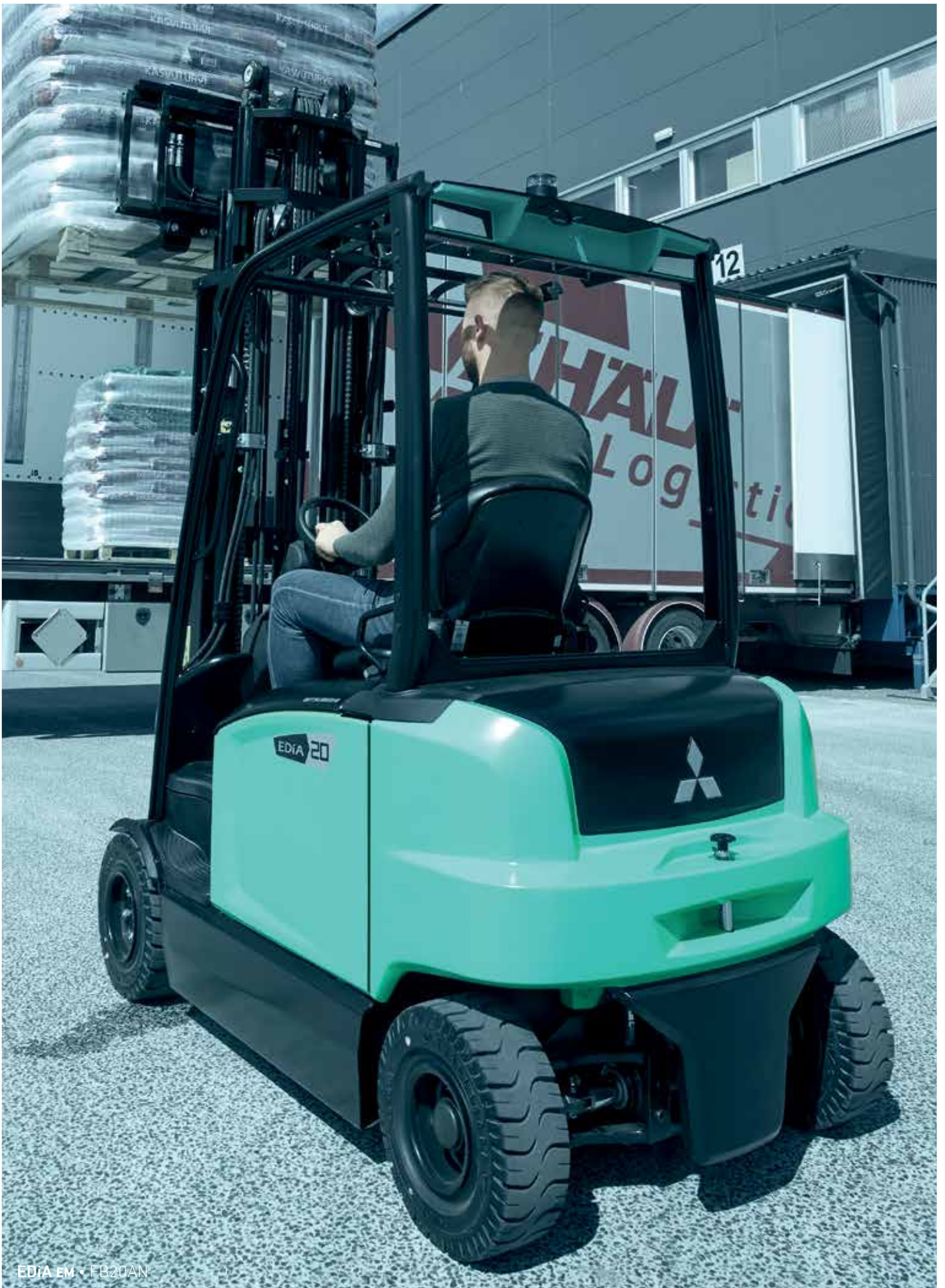
EDIA EM • FB20AN