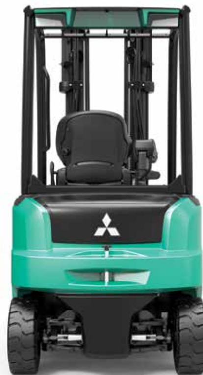
EDiA EM • FB20AN

Piense en lo más importante, y el resto vendrá solo.