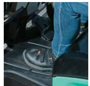
Espaciosa zona para pies